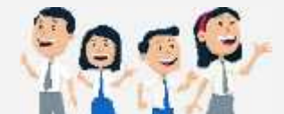
Surat Keterangan Tidak Mampu Dari Kelurahan